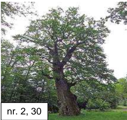
nr. 2, 30

De meest bijzondere boom op ons volkstuincomplex is de Sequoia sempervirens , de Kustsequoia of ook wel Californische sequoia of Kustmammoetboom genaamd. Het is de enige hiervan op ons complex. Een familielid ervan is de Mammoetboom ( Sequoiadendron giganteum ) die o.a. in Trompenburg te zien is. Sequoia's zijn 's winters groenblijvend. Dit onderscheidt ze dus van de Metasequoia's (11, 13, 37) en de Taxodium (nr. 10) die voor de winter hun naalden laten vallen. Sequoia's komen van oorsprong voor in het zuidwesten van de VS, zoals in Californië langs de kust. De schors voelt zacht en vezelig aan. De boom kan zeer hoog en dik worden, maar in ons klimaat is dat wat minder.